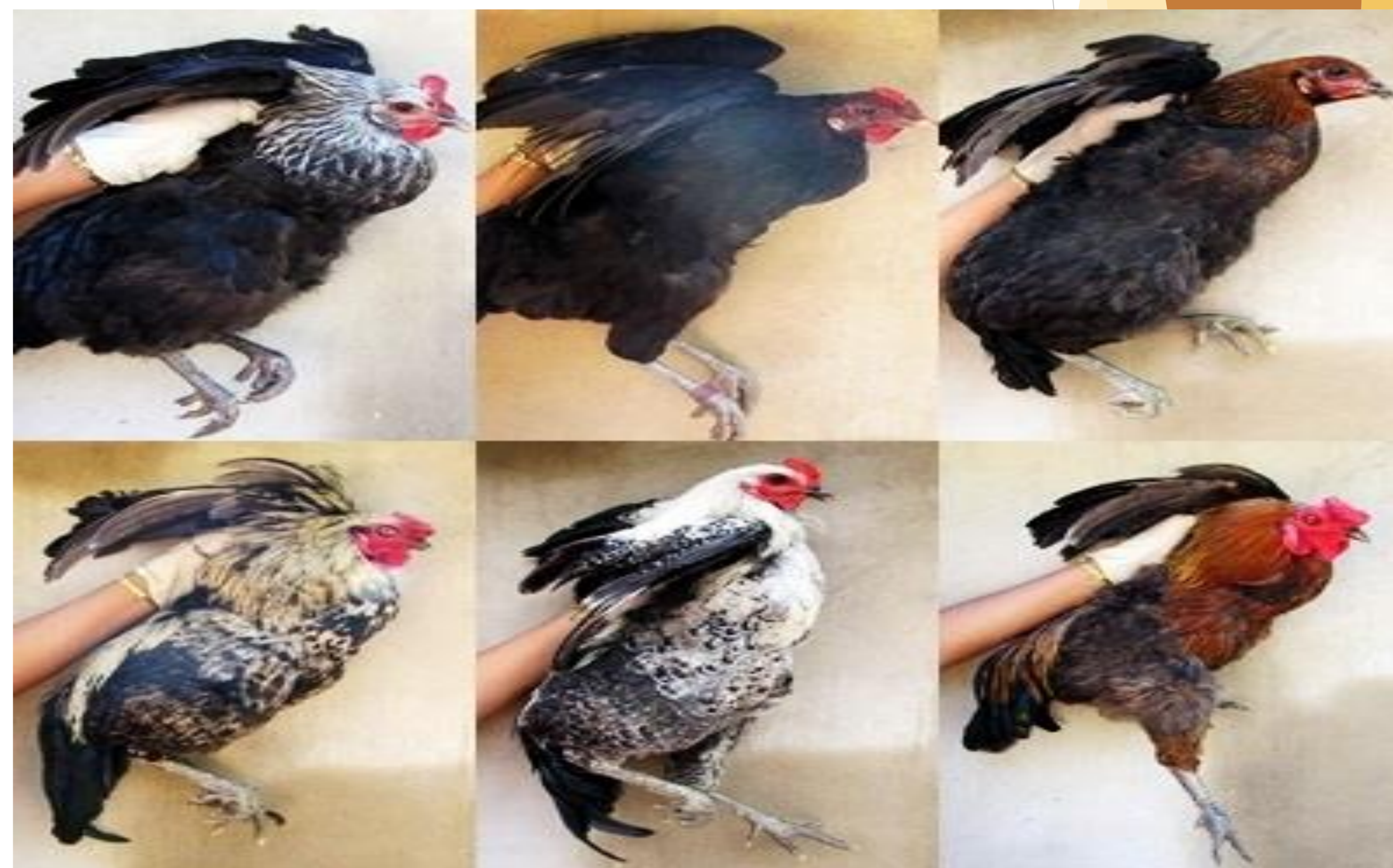
Perfil fenotípico qualitativo das aves da raça Canela-Preta (fêmeas e machos)